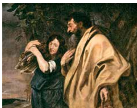
Abraham en Isaäk, Anthony van Dyck

Iedere week komen wij op zondag bijeen om te vieren rond Woord en Tafel. Doorgaans gaat dan de pastoor of een gastpriester voor. Er zijn mensen die ook best wel eens in de viering willen 'preken'. Dat is mogelijk met de preek van de leek, waar we in het vorig seizoen mee gestart zijn. De reacties op de lekenpreken waren positief. In dit seizoen zullen op twee zondagen opnieuw twee leken de 'preek' mogen verzorgen. Wilt u één van hen zijn? Meld u dan aan bij pastoor Wijker. De eerstvolgende keer dat de preek van de leek gehouden zal worden, is op zondag 17 november. De voorbereiding zal in overleg plaats vinden in oktober.